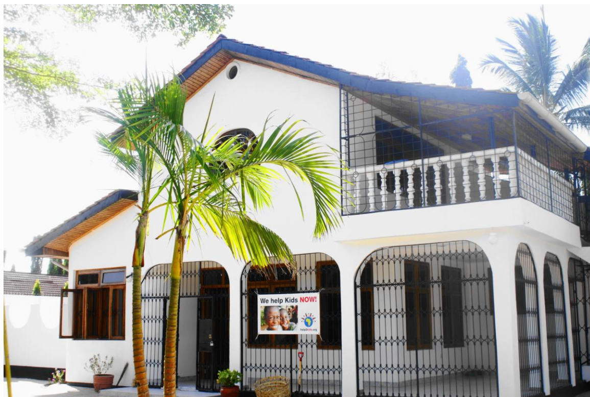
Bild help2kids Waisenhaus, in Dar es Salaam, Tansania.

help2kids entstand aus der persönlichen Erfahrung der Gründer bei einer Reise durch Ostafrika. Obwohl sie sich sehr sorgfältig auf die Reise vorbereitet haben, wurden sie von den dort herrschenden Realitäten überwältigt. Sie waren erschüttert über die unvorstellbare Armut der Menschen, die erschreckenden Lebensbedingungen und die unzureichende medizinische Versorgung, welche selbst heilbare Krankheiten oftmals tödlich enden lässt. Gleichzeitig hat Afrika auch die Herzen der beiden Gründer geöffnet. Sie durften unglaublich beeindruckende und bewegende Momente mit den Menschen erleben. Nach ihrer Heimkehr haben sie beschlossen den Kindern in Afrika persönlich zu helfen. Langsam begann das Projekt Formen anzunehmen.